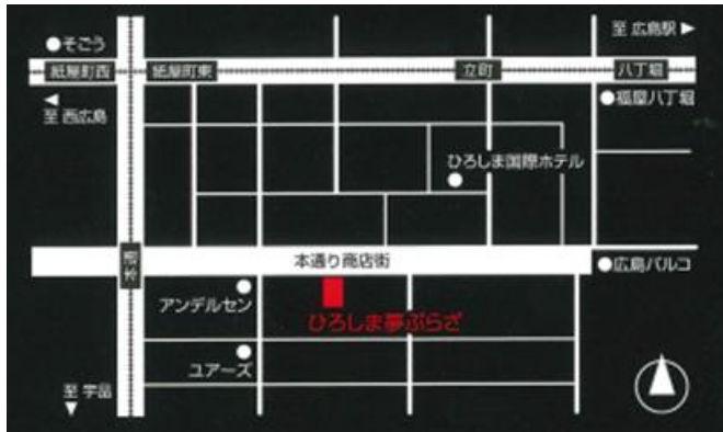
(ひろしま夢ぷらざ 地図)